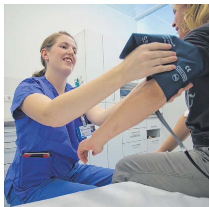
Die Spitalsambulanzen sind inzwischen das ganze Jahr über stark frequentiert. Im Sommer verschärft sich die Lage oft.

Der Kurienobmann: „Selbstverständlich sind die Spitalsärzte rund um die Uhr für die Patienten da und bieten die beste Notfall-Versorgung an. Allerdings ist es durch einfache Maßnahmen möglich, den einen oder anderen Notfall von vornherein zu ver-