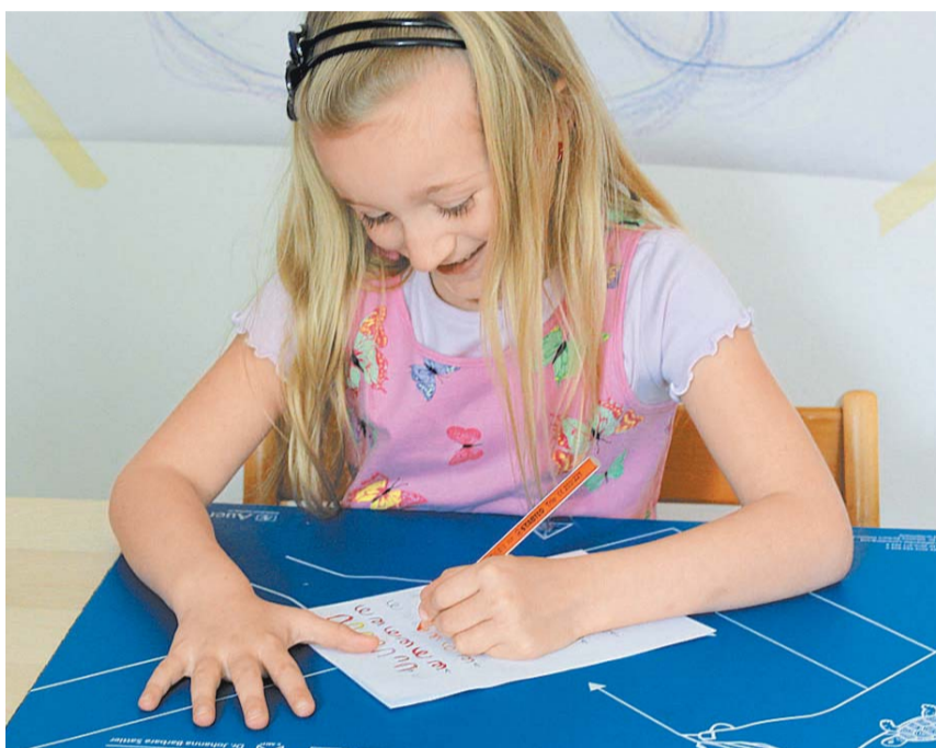
Eine lockere Schreibhaltung erleichtert Linkshändern die Arbeit deutlich.

Doch es gibt eine einfachere Lösung: Anstelle der Hand