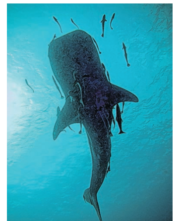
Walhaie faszinieren Taucher und Schnorchler.

Heidelberg – Ein gesunder Lebensstil bringt bis zu 17 Jahre: Das errechneten Wissenschaftler des Deutschen Krebsforschungszentrums aus den Daten von 25.000 Personen. Am meisten Lebenszeit kostet das Rauchen – nämlich Männer neun und Frauen sieben Jahre. Mehr als drei Jahre verliert man durch Übergewicht bzw. Alkohol, der Genuss von viel rotem Fleisch kostet 1,4 bis 2,4 Jahre. Am kürzesten lebt der adipöse starke Raucher, der viel Alkohol und rotes Fleisch konsumiert. (APA)