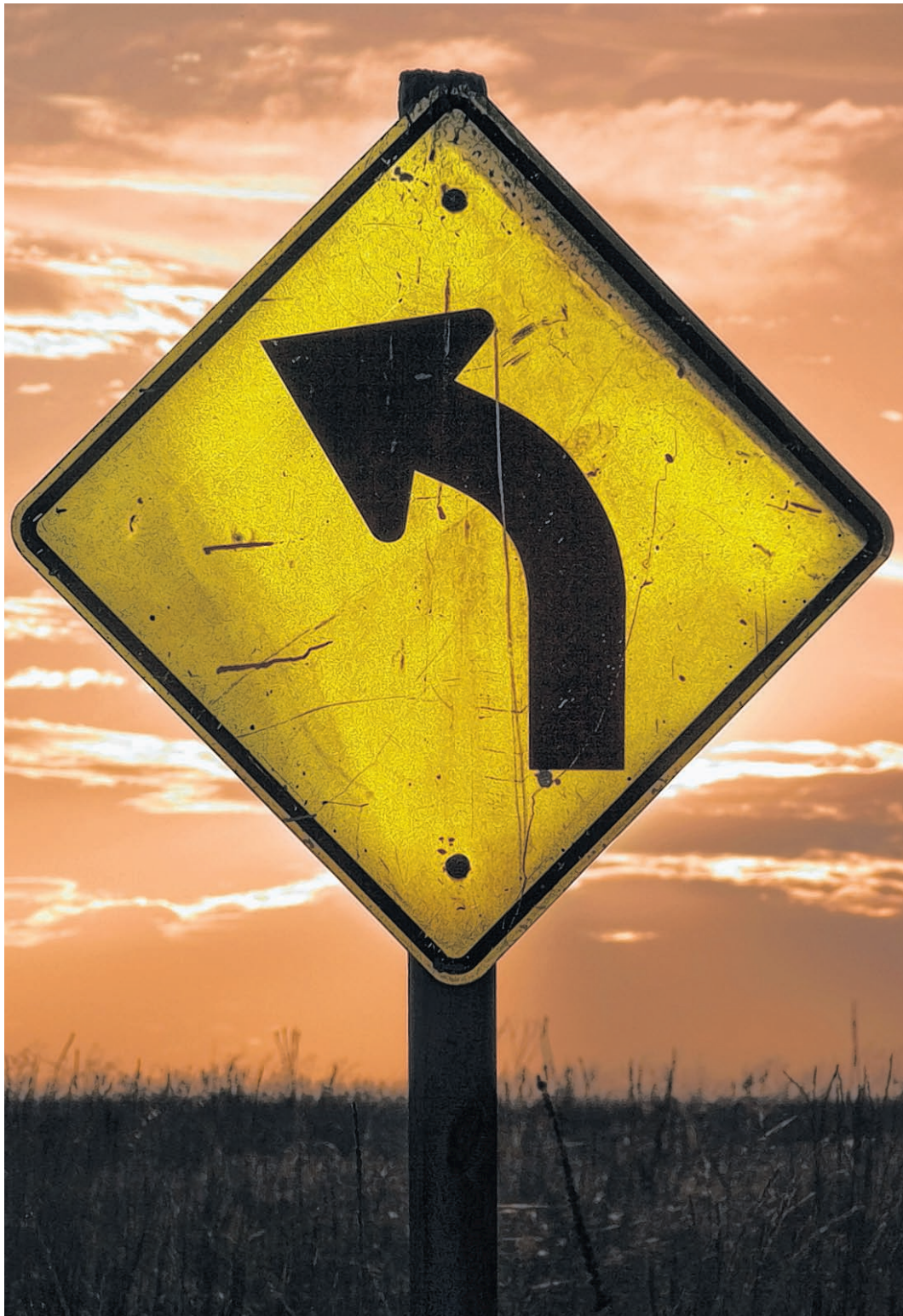
Die Wahl für „links“ trifft nicht nur auf Zustimmung.

Noch vor 30 Jahren wurden linkshändige Kinder umerzogen. Der heutige Weltlinkshändertag soll zeigen, dass die Welt immer noch auf Rechtshänder ausgelegt ist.